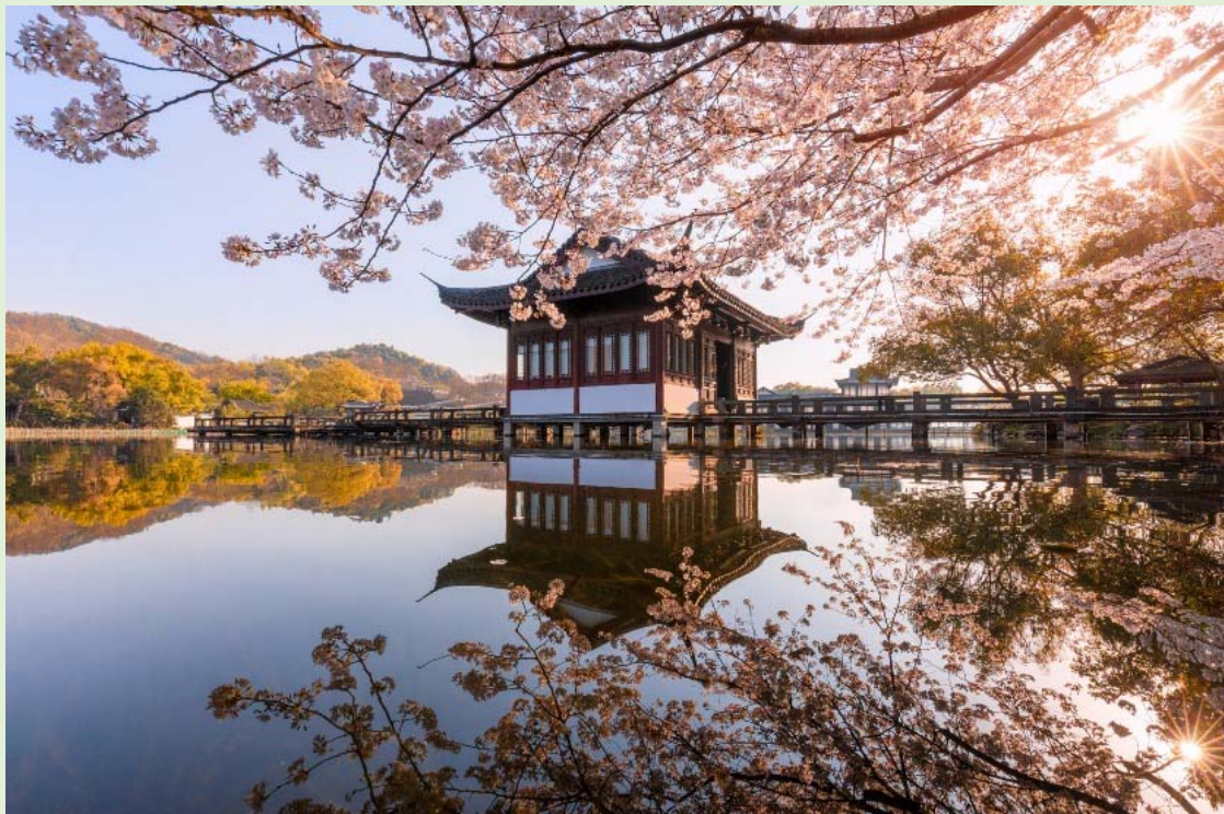
▲杭州西湖櫻花盛放時，景色美絕。

西湖位於浙江省杭州市西面，佔地 3,000 多公頃。著名的「西湖十景」，包括蘇堤春曉、平湖秋月、雷峰夕照等。這些景觀匯集了西湖一年四季，晴雨風雪，千姿百態的勝景。當中的蘇堤是連接西湖南北兩岸的堤壩，是蘇東坡在杭州做官時所修建。而連接西湖東西兩岸的白堤，則是唐朝詩人白居易所修築。由於西湖風景美絕，歷來吸引不少文人雅士以西湖為題，賦詩及創作傳奇故事，著名的民間傳說《白蛇傳》就是以西湖為背景。經過千多年的時間流逝，遊客現今仍熱愛暢遊西湖，欣賞西湖的優美風光。