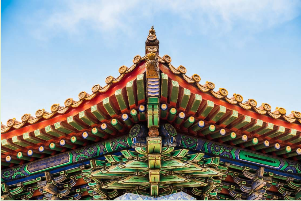
▲ 紫禁城宮殿的斗拱，即採用榫卯結構。