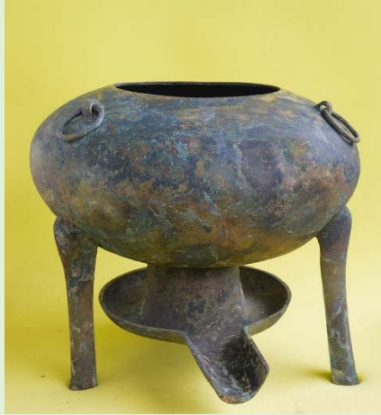
▲圖一：海昏侯漢墓出土的青銅火鍋。