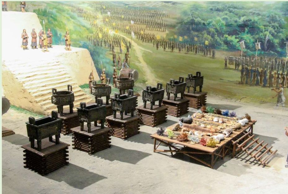
▲夏朝時，各部落首領為夏王獻上特產，九鼎的陳設展示了中原王權的威嚴。

相傳夏朝初年，夏王大禹劃分全國為九州（九個行政區），同時鑄造九個鼎，象徵九州，並把各州的名山大川、奇異之物都刻在九個鼎上。造好後，把九個鼎集中放置於夏王朝都城，代表各地都臣服於夏王朝，九鼎成為鎮國之寶。隨後的商朝和周朝時，鼎成為國家最高權力的象徵，構成中國古代國家觀念的具體形象。