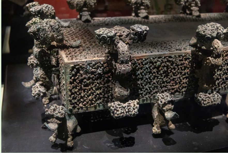
▲圖二：雲紋銅禁上的神獸和雲紋，四邊和四個側面飾有多層立體透雕雲紋，花紋精細。

我國古人製作「雲紋銅禁」，在於以盛酒禮器的具體形象來提醒統治者，要吸取前朝君主沉迷享樂，敗壞國家的教訓。今天我們欣賞這件巧奪天工的文化瑰寶時，也可從中理解古人以史為鑒的深刻哲理。