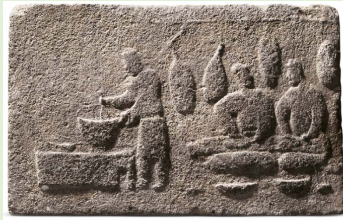
▲圖二：漢代畫像磚《庖廚圖》