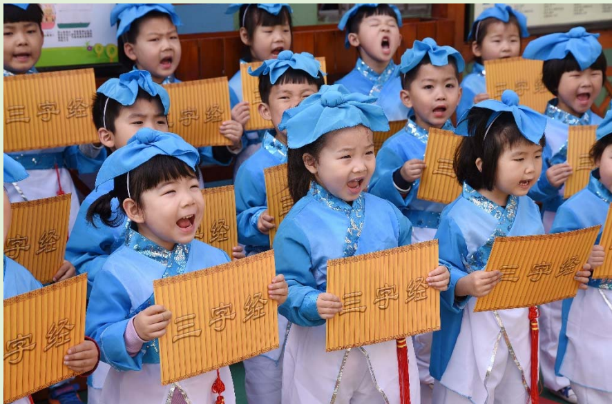
▲《三字經》是古代最受歡迎的兒童課本

「人之初，性本善，性相近，習相遠。」這是《三字經》的開篇句子，表示人剛出生的時候，稟 1 性是善良。每個人的稟性本來是很接近的，只是由於後天的生活環境和學習環境不同，差異就越來越大。《三字經》三字一句，文字淺明易懂，容易背誦。這書是古時廣為流傳的兒童讀本，內容包括天文、地理、倫理、歷史等。例如敘述古人勤奮向學的故事，讓兒童明白仁、義、誠、敬、孝，從中了解中國傳統的道德觀念和做人的道理。古人說熟讀《三字經》，不只可以知道天下的事情，而且可以藉了解古代聖人的禮儀和行為培養個人的品格。由《三字經》的內容可見，古人十分重視兒童的品德教育，而這亦是中華文化的優秀傳統，至今仍然受到重視和發揚。