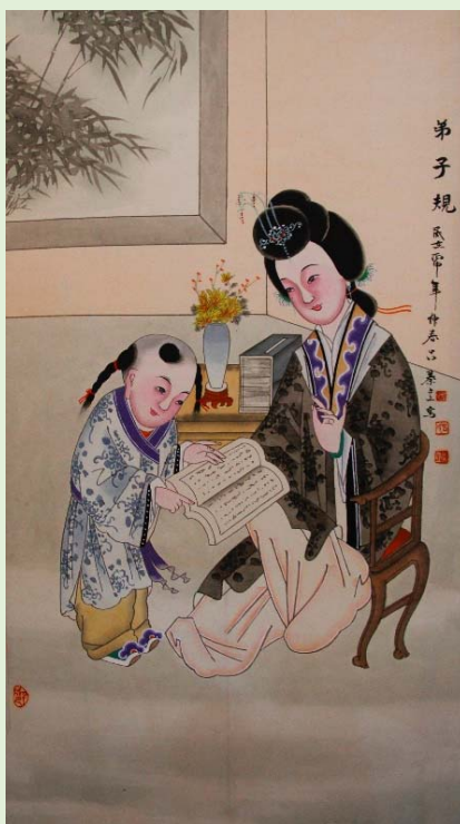
▲ 山東濰坊楊家埠木版年畫《弟子規》

雖然《弟子規》是一本古代兒童書籍，但書中提倡孝、悌、忠、信等價值觀念，到今天並不過時。我們應當守護和發揚這些傳統的美德。