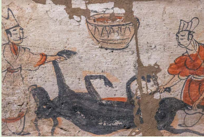
▲圖一：中國國家博物館藏有魏晉時期的宰牛畫像磚。