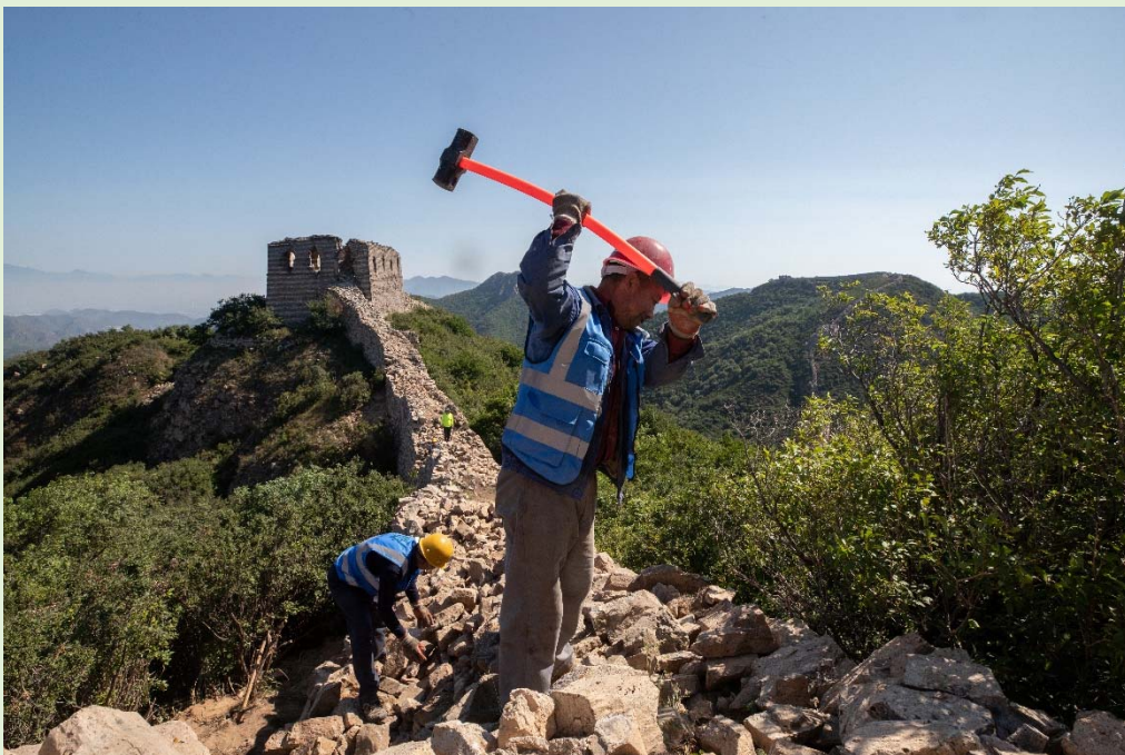
▲ 北京市昌平區流村鎮的明長城上，工人正在清理碎石，以便重新修築。

國家文物局是主要負責保護長城的部門，它負責制定法規、設立保護方案、議定維修程序等，再由各省的文物局落實執行。近年，國家文物局亦鼓勵社會人士積極參與保護長城，例如招募居住在長城附近的農民來擔任保護員，負責定期巡查長城現狀，並向當局匯報，以便當局作出適時的維修和保護。2024 年 5 月國家主席習近平回信問候北京八達嶺鎮石峽村的鄉民，肯定他們自發參與長城的保護工作，可見愛護和保護如長城的文化遺產，是中華民族的共同心願。