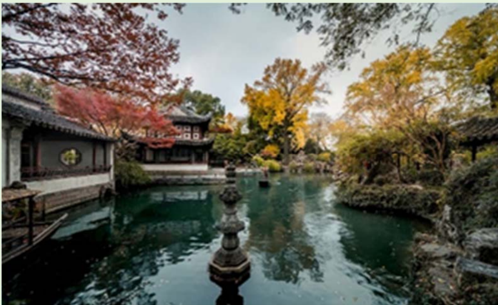
▲蘇州留園美麗的園林景致。

蘇州的名園各有特色。例如，滄浪亭是蘇州的一座古老園林，建於北宋年間（公元 960 年—公元 1127 年），園外有池水圍繞，園內以石山為主。另一名園獅子林，建於元朝（公元 1271 年—公元 1368 年）的後期。園內有精美的湖山假石，造型大多與獅子相像，營造出幽雅景致。拙政園建於明朝（公元 1368 年—公元 1644 年），是蘇州最大的一座園林，四處皆以水為設計元素，且一步一景。留園始建於明朝，園內分為四個園景區，分別以山水、盆景、山林、廳堂庭院為主題。如果我們有機會到蘇州，一定要去各大名園，欣賞蘇州園林之美。