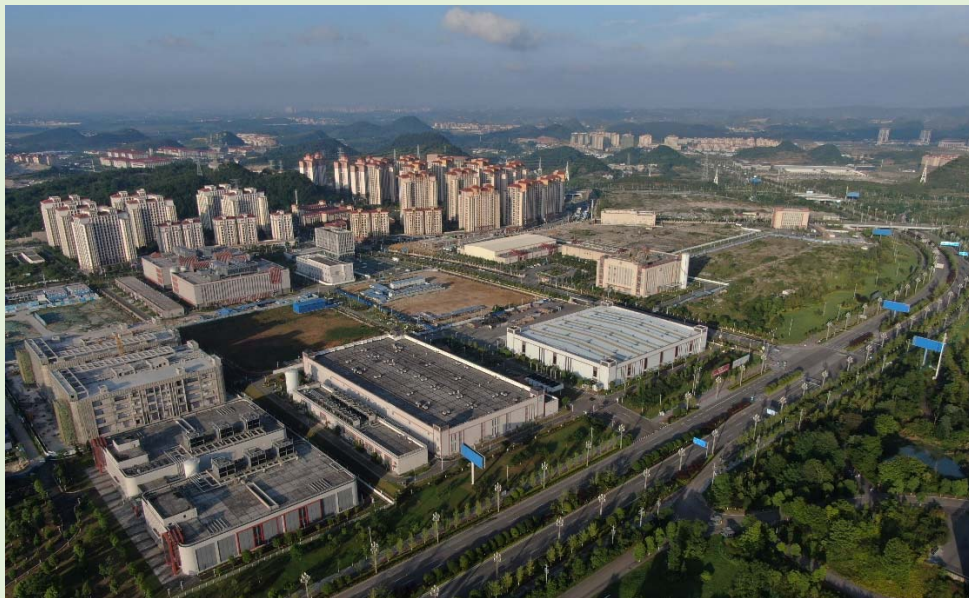
▲ 貴州省貴安新區中的科技園企業。

2022年2月，國家正式啟動「東數西算」工程。「數」是數據，「算」是運算力，即是數據處理能力，而「東數西算」，就是把東部地區的數據引導到西部進行運算，例如在貴州設立數據中心。「東數西算」可充分利用西部地區獨特的氣候、資源及環境等優勢，紓緩東部地區因人口多、城市化等原因，能源需求龐大的問題。「東數西算」工程促進東西部發揮資源互補的協同效應，從全國整體化布局考慮，發揮各地區的優勢，提升全國資源使用的效率。「東數西算」工程每年可帶動投資約4,000億元人民幣，有力促進西部地區的經濟發展，大大改善西部人民的生活。「東數西算」工程，對維護國家的經濟安全十分重要，通過這項工程，使國家的東西部得到均衡的發展，以確保國家經濟持續、健康和穩定發展。