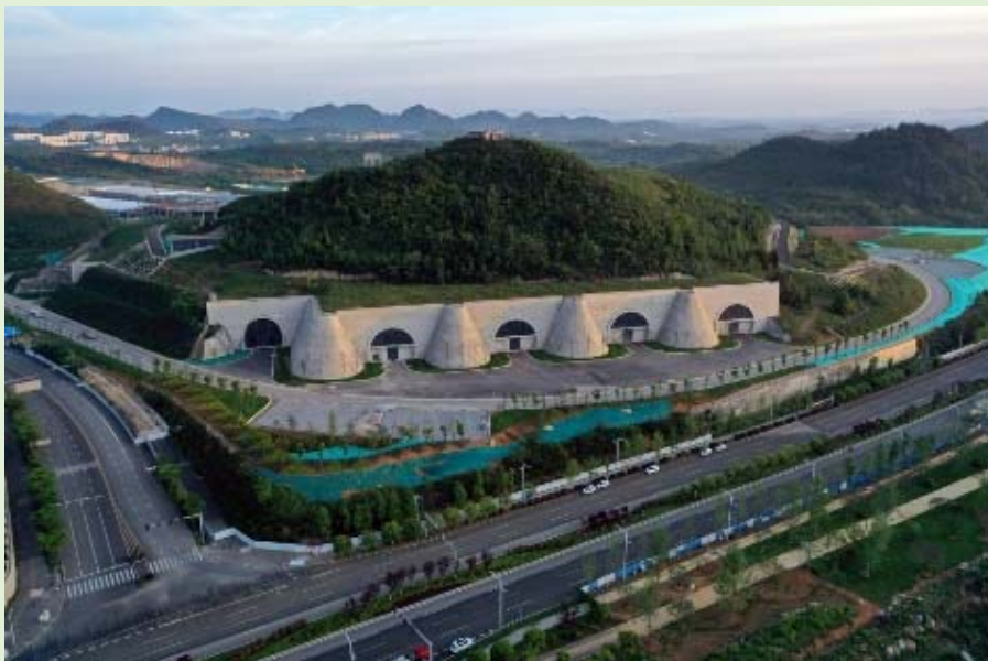
▲ 騰訊設在貴州貴安新區的七星數據中心，隱於群山中，建成之後外觀無明顯標識，所有核心設備均置於洞內。

貴州雖然地瘠人貧，但經過國家的重新規劃，將原本地理、氣候的缺點發展成優勢。貴州大部分地區全年平均溫度是攝氏 15 度左右，而且有大量天然溶洞，保持低溫，可以不需設置大量的空調機器，降低數據中心的用電量；加上貴州自然災害較少，而且地價及電價均較低，可以為企業節省成本。經過多年努力發展數據產業，貴州最終成為國家的數據中心，有「中國數谷」的稱譽。這樣除了帶來經濟效益，還保護了國家的數據安全，因為數據不只關乎人民生活 and 企業運作等，還涉及國家安全、社會秩序和公共利益，所以數據必須有效保護和合法利用。作為數據中心，貴州具備保障數據持續安全狀態的條件和能力。將來大家有機會到中國數谷參觀，不妨多了解一下這方面的設施和運作。