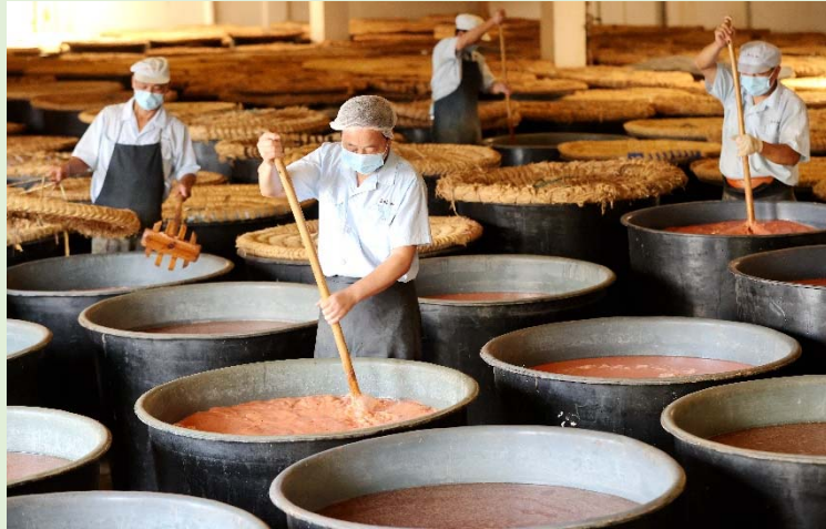
▲圖二：今人釀造酸醋